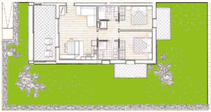
Il giardino privato esclusivo